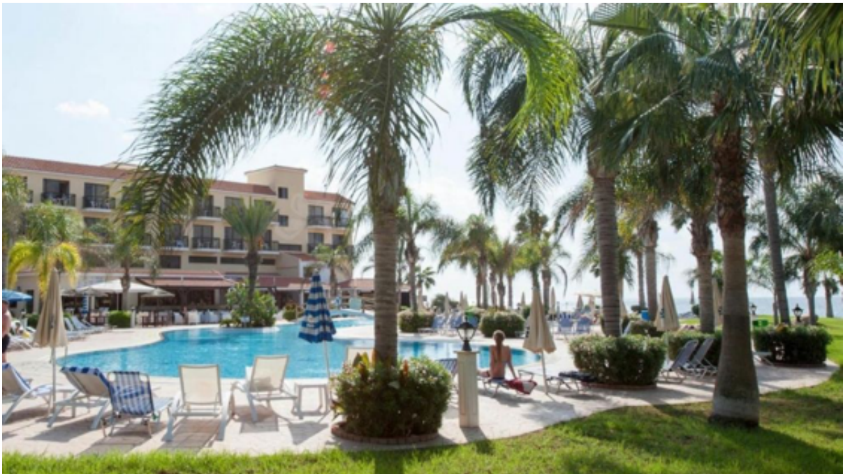
★★★★ Anmaria Beach Hotel, Ayia Napa. Pris från 11 557 SEK per person (halvpension ingår).