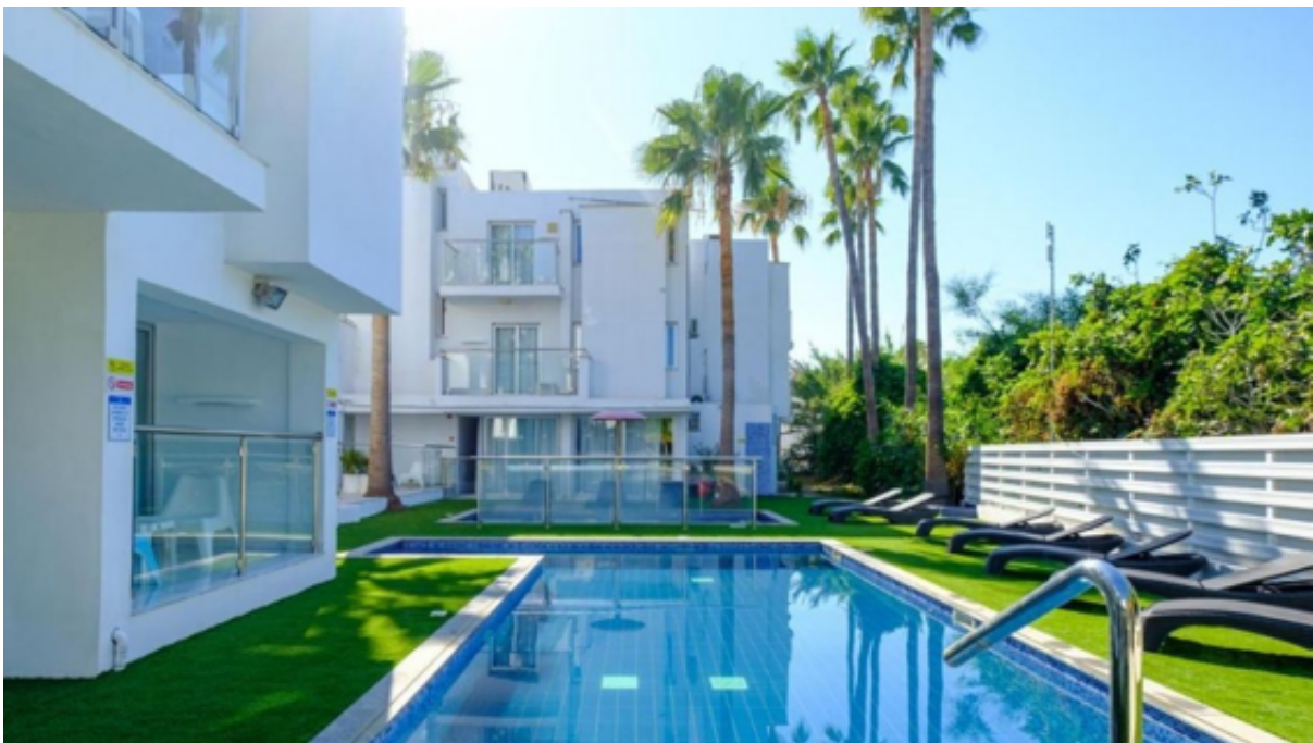
★★★ Rio Gardens, Ayia Napa. Pris från 8 969 SEK per person.